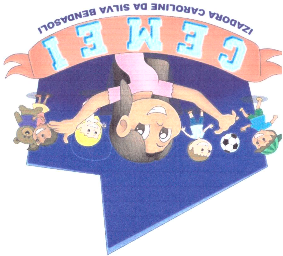
Projeto Político Pedagógico CEMEI "Izadora Caroline da Silva Bendasoli!"